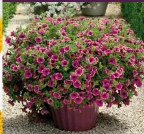
'Pretty Much Picasso'