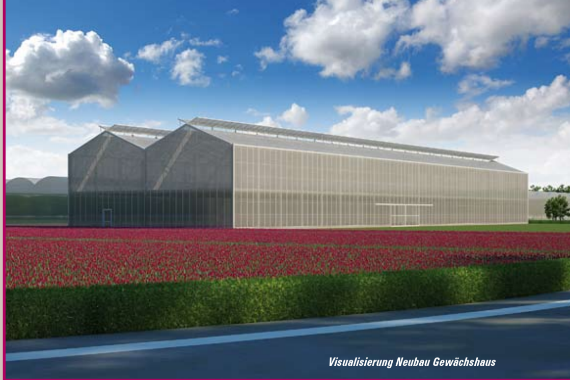
Visualisierung Neubau Gewächshaus

In einem ersten Schritt wird das Produktionsgebäude, welches dem Verkaufshaus angegliedert ist, durch einen Neubau ersetzt. Um unsere betrieblichen Abläufe zu optimieren, wird das neue Gewächshaus angrenzend an das bereits bestehende Produktionshaus gebaut. Dank einem ehrgeizigen Bauprogramm möchten wir Ihnen dieses spannende Projekt im